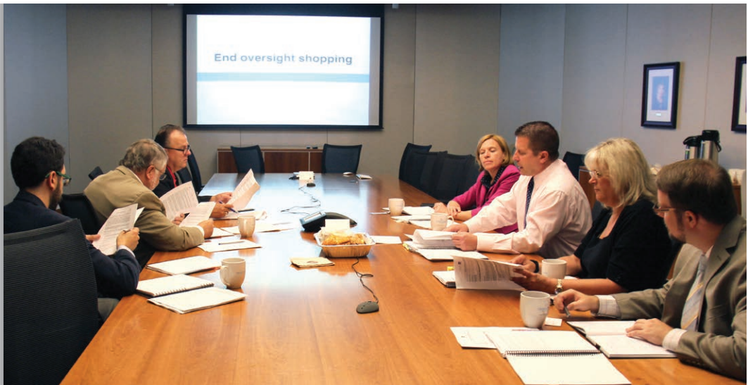
21 juillet 2015 : Les dirigeants du ministère des Affaires municipales et du Logement (dont le ministre Ted McMeekin, deuxième à partir de la gauche) rencontrent les membres de l'équipe de direction et les équipes juridiques de l'Ombudsman, lors d'une consultation sur l'examen des lois municipales par le Ministère.

Cependant, à notre avis, le changement qui serait le plus constructif pour renforcer la responsabilisation et la transparence partout dans la province serait d'exiger que toutes les municipalités aient des codes de conduite, avec un cadre uniforme d'application . Actuellement, les codes de conduite des municipalités sont rares et, quand ils existent, ils diffèrent grandement. Tout comme pour les réunions publiques, les normes d'intégrité du gouvernement local devraient être uniformes en Ontario.